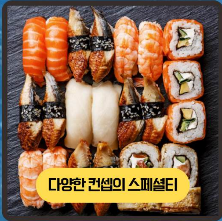
다양한 컨셉의 스페셜티