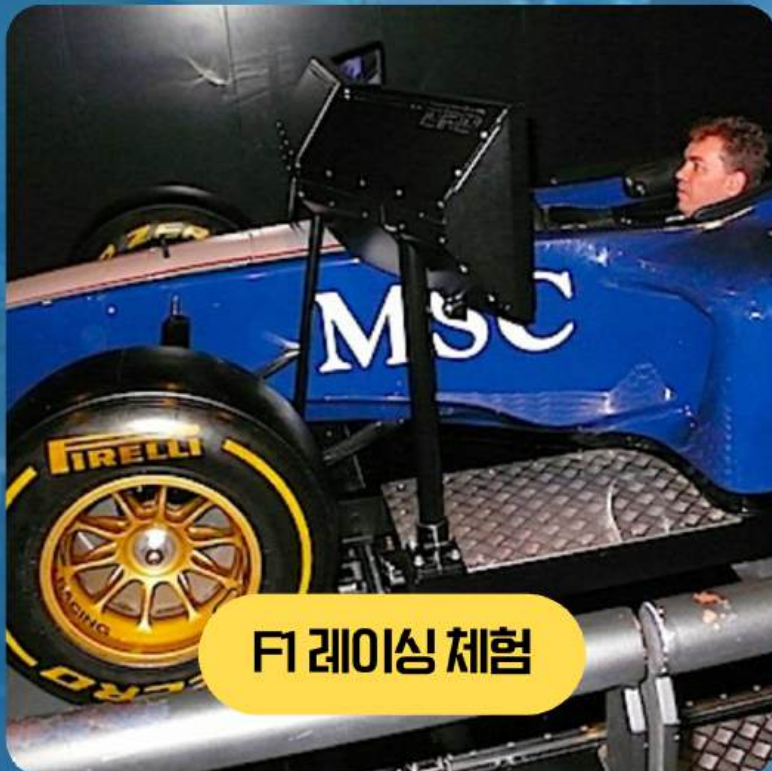
F1 레이싱 체험