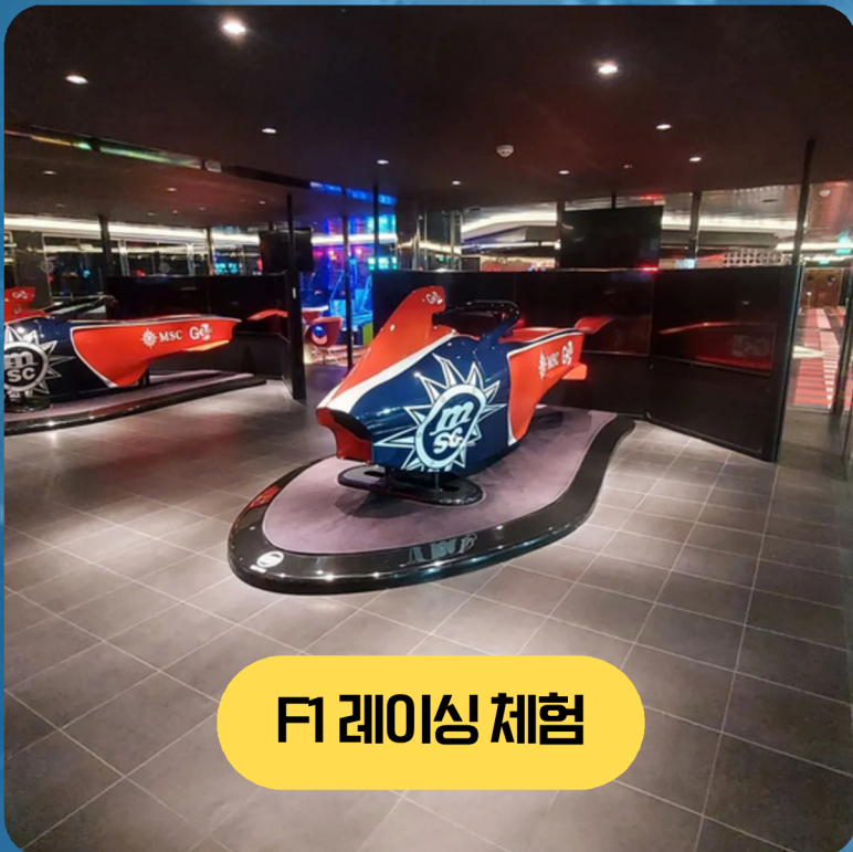
F1 레이싱 체험