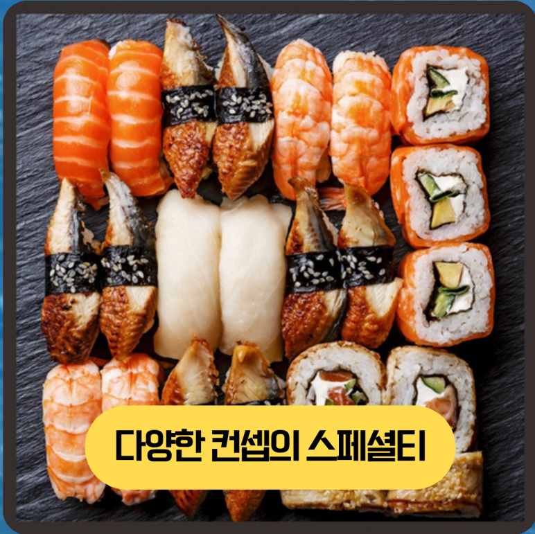
다양한 컨셉의 스페셜티