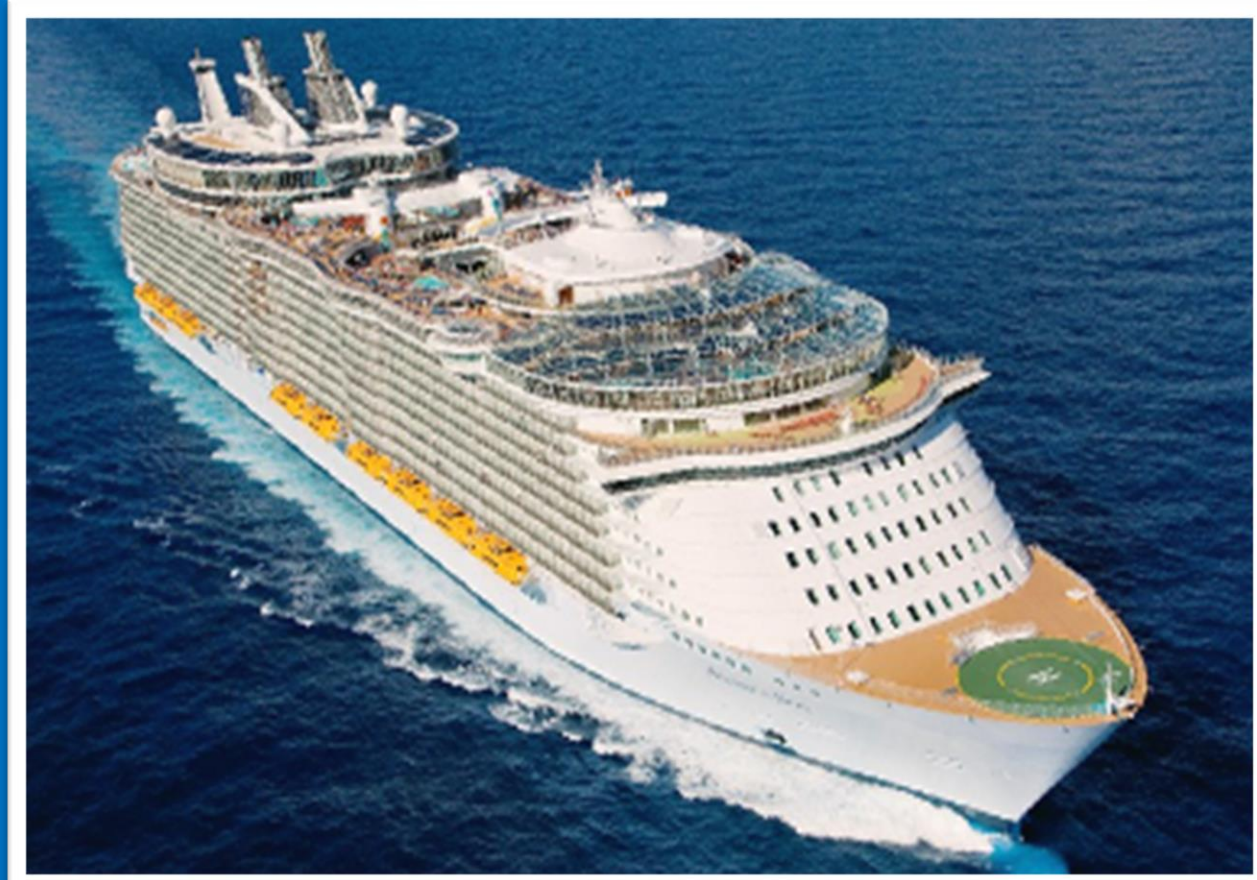
ALLURE OF THE SEAS