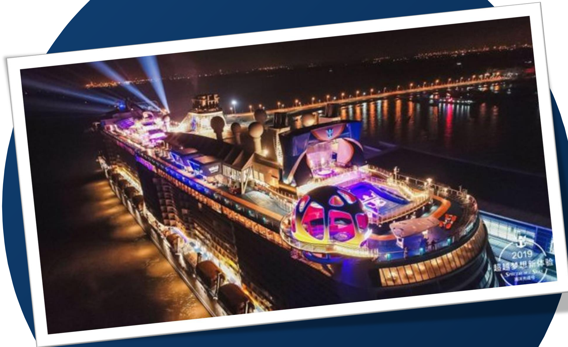
Spectrum of the Seas