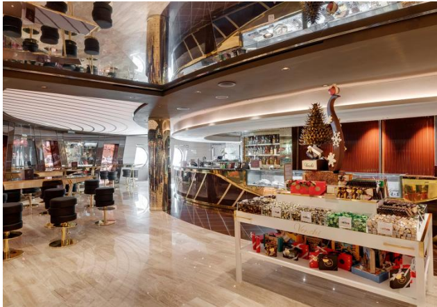
Venchi 초콜릿 바