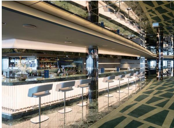
바 & 라운지