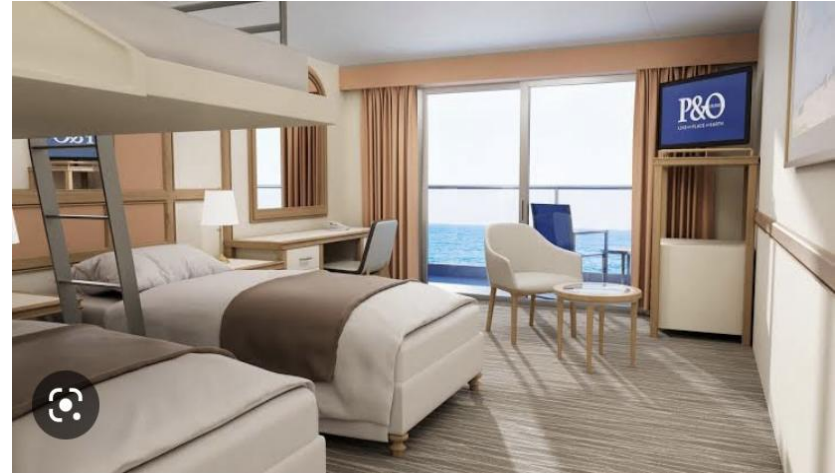
Deluxe Oceanview(디럭스오션뷰 /17㎡)