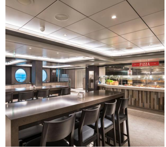
뷔페 레스토랑 마켓플레이스