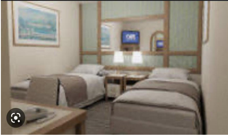
Deluxe Balcony(디럭스 발코니/22㎡)