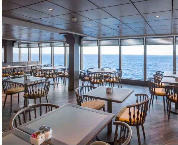
오션포인트 뷔페 레스토랑